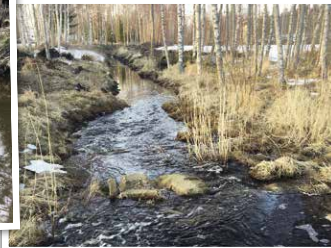
■ Valokuvia Sundet-projektista.