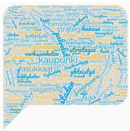
Ordmoln på basen av områdets kommunstrategier

Med tanke på det övergripande och hållbara utvecklandet av landsbygden består de viktigaste samarbetspartners av kommunerna och städerna i området, Österbottens och Mellersta Österbottens förbund samt NTM-centralen i Österbotten. Tillsammans med dessa aktörer byggs en hållbar framtid i landsbygdsområdena i Österbottens kustregion. Samtidigt aktiveras företag och föreningar i området att delta i regionutvecklingen.