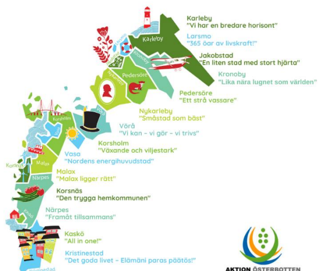
Bild 1 Verksamhetsområdets kommuner och städer

Landskapet Österbotten är ett landskap med 14 kommuner och 176 000 invånare på västkusten i Finland. Markytan på cirka 7 400 km 2 består av en 230 km lång och cirka 20–50 km bred kustremsa. Landskapet indelas i Jakobstadsregionen (ca 50 000 inv.) hit hör Kronoby, Larsmo, Pedersöre, Jakobstad och Nykarleby., Vasaregionen (ca 100 000 inv.) hit hör förutom Vasa även Korsnäs, Malax, Korsholm, Vörå och Laihela. Kristinestad, Kaskö och Närpes bildar tillsammans Sydösterbotten (ca 17 500 inv.)