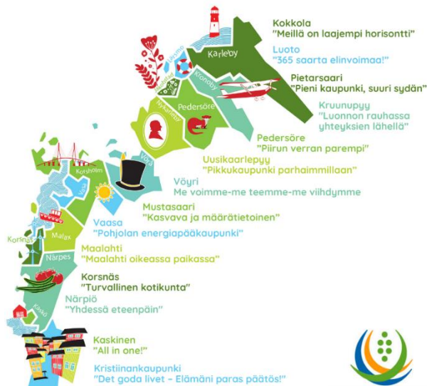
Kuva 1 Toiminta-alueen kunnat ja kaupungit

Pohjanmaan maakunta on 14 kunnan ja 176 000 asukkaan maakunta Suomen länsirannikolla. Noin 7400 km 2 maapinta-ala muodostuu 230 km pitkästä ja noin 20 – 50 km leveästä rannikkokaistaleesta. Maakunta jakautuu kolmeen seutuun. Pietarsaaren seutuun (n.50 000 as.), kuuluvat Kruunupyy, Luoto, Pedersöre, Pietarsaari ja Uusikaarlepyy. Vaasan seutuun (n.100 000 as.) kuuluvat Vaasan lisäksi Korsnäs, Maalahti, Mustasaari, Vöyri ja Laihia. Kristiinankaupunki, Kaskinen ja Närpiö muodostavat Suupohjan rannikkoseudun (n. 17 500 as.).