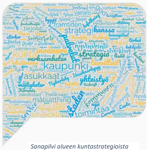
Sanapilvi alueen kuntastrategioista

Kokonaisvaltaisessa ja kestävässä maaseudun kehittämisessä tärkeimmät kumppanit ovat alueen kunnat ja kaupungit, Pohjanmaan ja Keski-Pohjanmaan liitot sekä Pohjanmaan ELY-keskus. Näiden toimijoiden kanssa rakennetaan yhdessä kestävää tulevaisuutta Pohjanmaan rannikkoseudun maaseutualueille ja aktivoidaan alueen yrityksiä ja yhdistyksiä mukaan aluekehittämiseen.